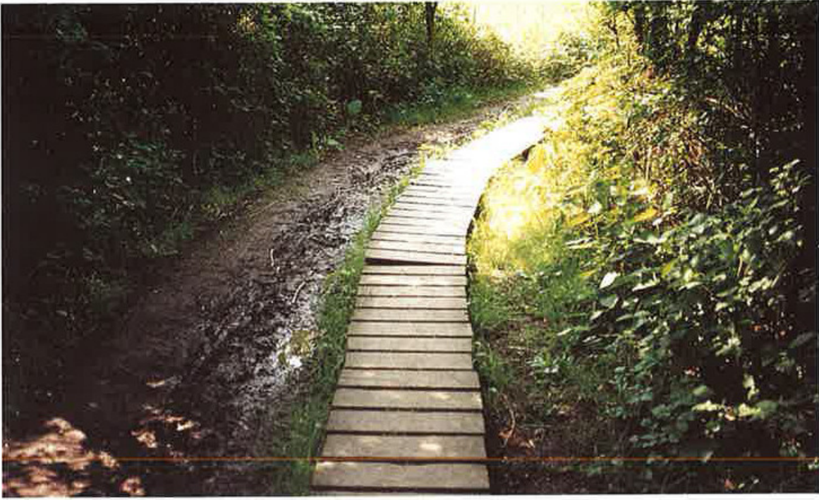
Espaces humides aménagés