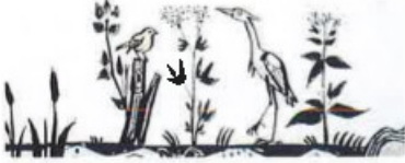
Exemple de texte narratif, pause n°6.

Si jamais le héron a profité de ce court instant s'échapper, alors j'ai droit à un reproche : "Tiens ! tu fais perdre la parole."